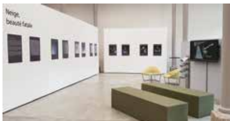
Exposition «Neige, beauté fatale», aux Arsenaux

neige. Celle-ci vous emmène à la découverte des avalanches et des cristaux de neige dans leur état initial ou après métamorphose. On y verra de belles étoiles caractéristiques mais aussi l'empreinte d'un cristal dans une goutte d'eau ou encore des grains totalement reconstruits par les processus thermodynamiques que connaît le manteau neigeux... L'occasion également d'observer l'évolution de cet élément qui peut se transformer en un risque naturel bien connu dans l'espace alpin: l'avalanche.