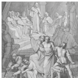
Das Ketzergericht. Die Entwicklung der Gottesidee. Düsseldorf, 1850