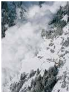
LAVINA 01, 2006