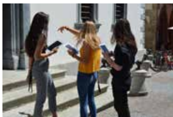
GuidiGO © Médiathèque Valais, Sion, Antoine Quarroz

Randos-découvertes ludiques d'une à deux heures dans différents lieux du canton afin d'observer les indices des risques dans le paysage. Les randos-découvertes sont conçues comme une activité en famille, à faire avec des enfants à partir de sept ans. Les lieux mystères seront notamment dévoilés via nos pages Facebook et Instagram et à l'adresse vallesiana.ch/risk .