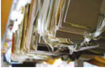
Archives syndicales - Gewerkschaftsarchiv

Le Valais n'a plus accueilli l'assemblée générale des archivistes suisses (AAS) depuis 1989. Depuis lors, le métier a connu une véritable (r)évolution avec la standardisation des normes et le développement de la gestion des documents, de l'archivage électronique ou encore de la médiation culturelle. Trente ans plus tard, les Archives de l'État du Valais et les Archives municipales de Sion s'associent pour recevoir la 95 ème assemblée générale de l'AAS et sa journée professionnelle intitulée «Savent-ils vraiment ce qu'ils font? La politique d'évaluation des archives vue par les utilisateurs».