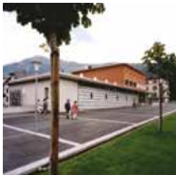
Mediathek Wallis - Brig © MW