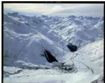
Forêt de protection mise au ban au-dessus d'Andermatt, 1980 /

Au Pénitencier, le parcours proposé dans l'exposition RISK par le Musée d'histoire et le Musée de la nature permet de découvrir le regard que nos sociétés portent sur les risques, de connaître les stratégies mises en œuvre pour éviter les catastrophes, de partir à la rencontre des professionnels de la gestion des risques et d'interroger les liens que nos sociétés entretiennent avec leur écosystème.