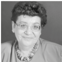
Pilar Ayuso