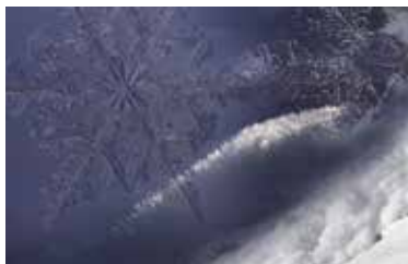
Bild der Ausstellung «Schnee, tödliche Schönheit» Photomontage © R. Bolognesi