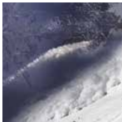
Détail du photomontage réalisé par Robert Bolognesi