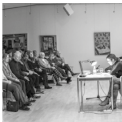
Literarischer Salon © Sobluwe Weina