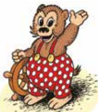
Petzi - Dessin de Vilhelm Hansen © Rasmus Klump AS, 2018