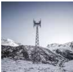
«Totems». Détail