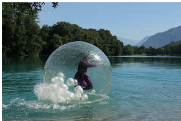
Greenhous effect, photographie, 60 x 90 cm, 2015