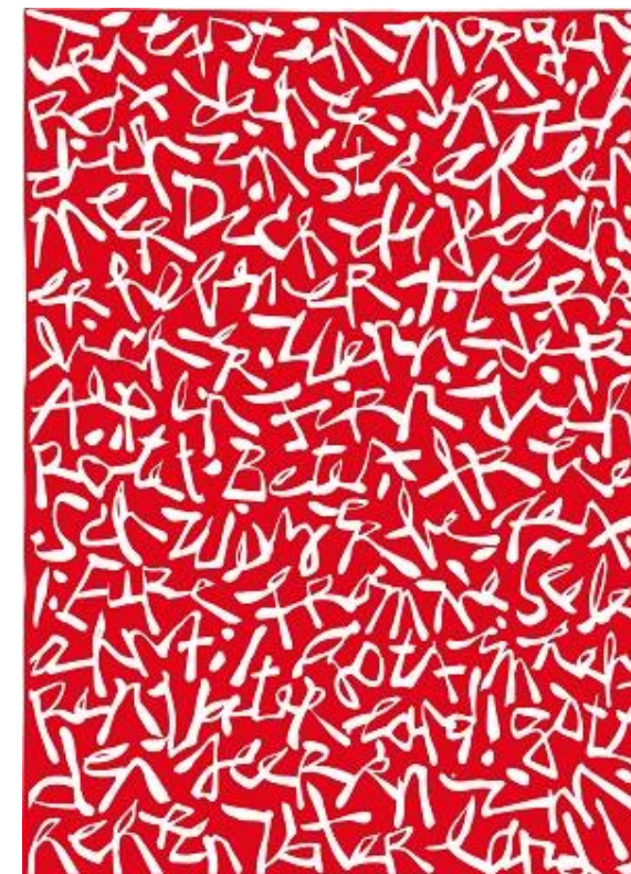
© Renato Jordan Schweizer Hymne : „Trittst im Morgenrot daher...“ , sérigraphie, 42 x 30 cm, 2009