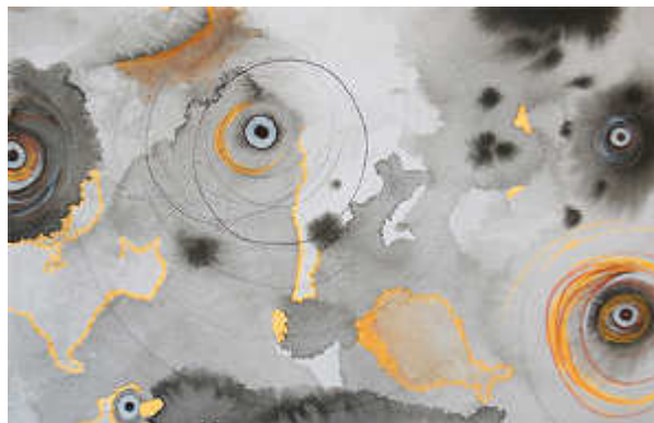
© Laetitia Salamin Oculaires , Techniques mixtes sur papier-carton, 12 x 18 cm, 2016