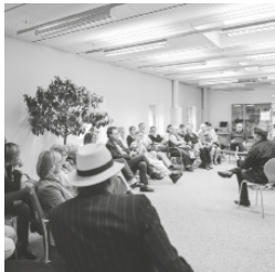
Literarischer Salon

Schlossstrasse 30 - 027 607 15 00 mw-brig-kulturvermittlung@admin.vs.ch www.mediathek.ch