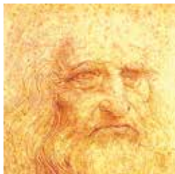
Léonard de Vinci

Conférence suivie du concert «Minimal Gesture Trio», 19h30 Jeudi 10 octobre, salle de conférences, 18h15 - 19h15