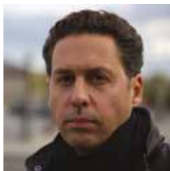
Karim Amellal © Droits réservés