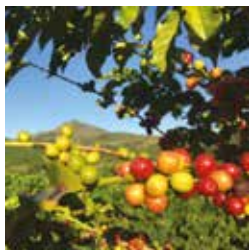
Fruits de caféiers

Samedi 8 novembre, espace enfants, 18h15 - 19h15