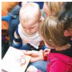
Né pour lire... quand la lecture se décline en famille