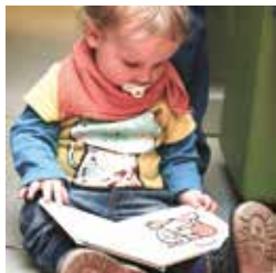
Les petits aiment les livres...