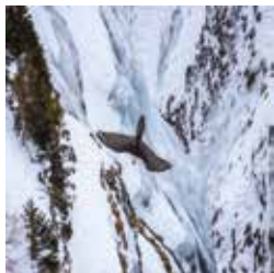
Le gypaète

Avenue du Simplon 6 - 027 607 15 80 mv-stmaurice-mediation@admin.vs.ch www.mediathèque.ch