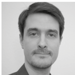
Yves Fournier, musicologue

Les instruments de musique de Léonard de Vinci Jusqu'au 31 octobre